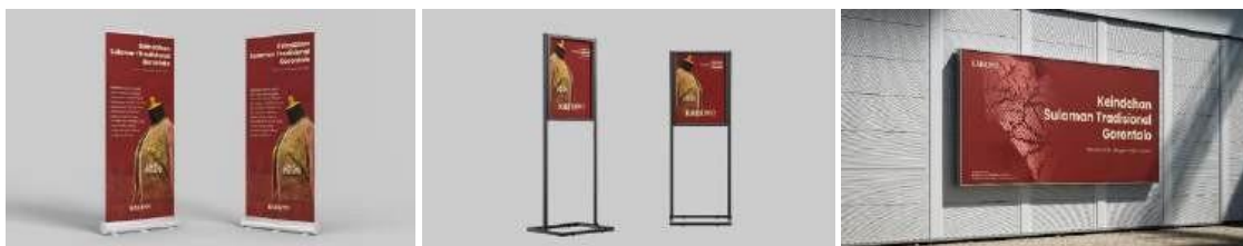
Gambar 3. Tampilan X Banner, Poster, dan Billboard

Media pendukung adalah alat tambahan yang digunakan untuk memperkuat, melengkapi, atau memperluas jangkauan dari media utama. Media pendukung dapat mencakup elemen-elemen seperti X-banner, Poster, Billboard, T-Shirt, Keychain, Sticker dan Konten media sosial.