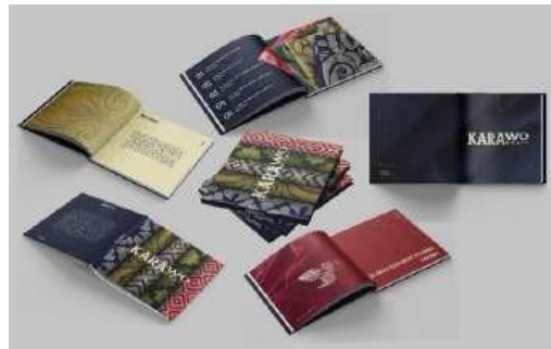
Gambar 2. Implementasi Media Utama

Media utama dalam implementasi desain merujuk pada platform atau format yang dipilih untuk mengeksekusi dan menyebarluaskan rancangan yang telah dibuat. Dalam konteks desain buklet untuk kerajinan karawo Gorontalo, media utama mencakup elemen fisik seperti kertas dan teknik percetakan, serta format digital jika diperlukan. Pilihan media utama harus disesuaikan dengan tujuan desain, target audiens dan anggaran yang tersedia. Media fisik seperti buklet cetak menawarkan keunggulan berupa daya tarik visual langsung, sementara media digital dapat menawarkan kemudahan akses dan lebih interaktif. Dalam tahap implementasi, pemilihan media utama akan mempengaruhi kualitas akhir desain, mulai dari ketajaman gambar, ketahanan material, hingga efektifitas dalam menyampaikan pesan informasi.