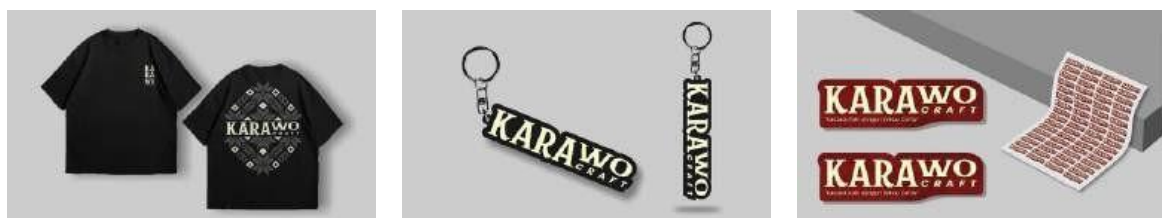
Gambar 4. Tampilan T-Shirt, Keychain, dan Sticker

Media promosi yang digunakan terdiri dari berbagai jenis dengan fungsi dan karakteristik yang beragam. X-Banner menjadi media utama yang dicetak menggunakan digital printing dengan ukuran 160 cm x 60 cm, dirancang untuk menarik perhatian audiens secara langsung. Selain itu, poster berukuran A3 yang dicetak menggunakan bahan Art Paper 150 gr digunakan untuk memberikan informasi kepada audiens dan dapat ditempatkan di berbagai lokasi strategis. Media lainnya adalah billboard, yang berfungsi mengiklankan produk, jasa, atau acara serta menyampaikan informasi kepada khalayak luas.