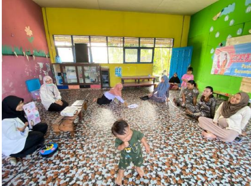
Gambar 1. Pemberian Materi dengan Media Lembar Balik kepada Peserta

pengisian kuesioner sebelum materi, lalu penyampaian materi promosi kesehatan. Selama penyampaian materi, narasumber menyampaikan hal-hal penting meliputi efek-efek obat yang merugikan bagi ibu hamil dan janin, kategori atau kelas obat yang aman untuk ibu yang sedang hamil dan menyusui, tanda-tanda anak stunting dan cara pencegahannya, suplemen dan vitamin yang penting dikonsumsi ibu hamil dan menyusui, dan pengelolaan obat DAGUSIBU (Gambar 1).