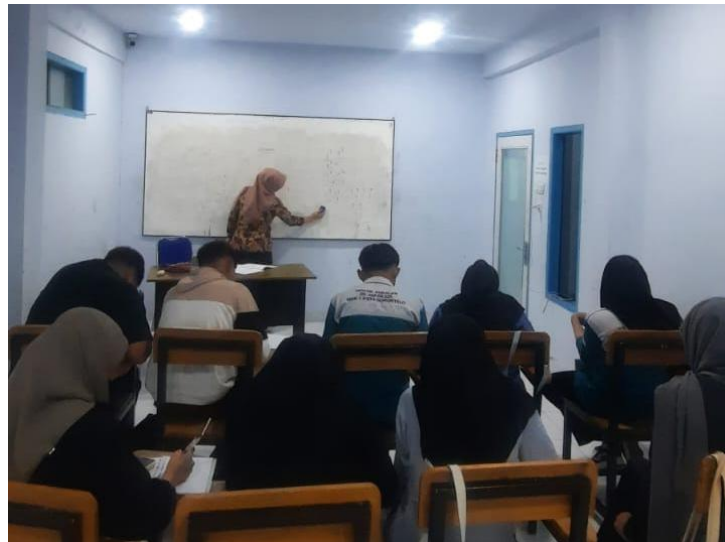
Gambar 2. Pendampingan Siswa MAN 1 Kota Gorontalo