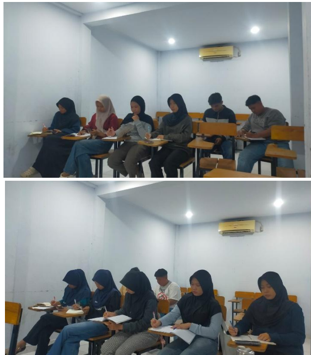
Gambar 1. Pemberian pre-test untuk memetakan pola kesalahan pada soal HOTS