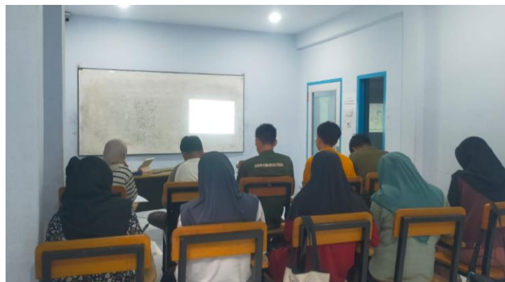
Gambar 3. Tahapan refleksi dan evaluasi