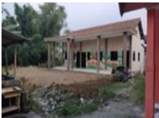
Gambar 6. Bentuk realisasi pembangunan infrastruktur Pembangunan PAUD Mickey Mouse Pencairan 1 (Thp3)