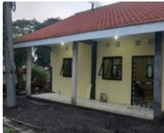
Gambar 5. Bentuk realisasi pembangunan infrastruktur Pembangunan Gedung TK DWP TROPODO