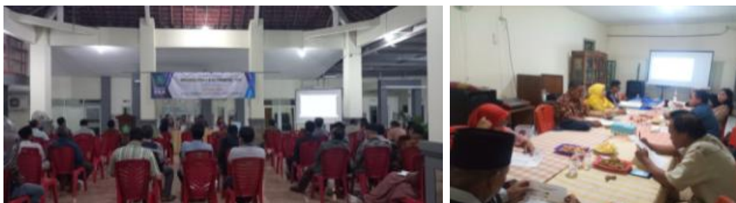
Gambar 1. Rapat Musrenbangdes dan Rapat Tim Pengesahan RKP

Dokumentasi gambar 1, merupakan kegiatan Pemerintah Desa Tropodo terkait rapat Musrenbangdes dan Pengesahan RKP tahun anggaran 2023.