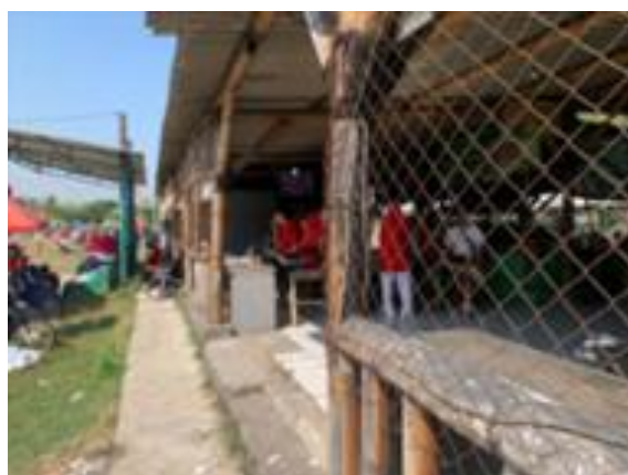
Gambar 8. Bentuk realisasi pembangunan infrastruktur Rehab Sarana Kios Pujasera Desa

Meskipun pembangunan infrastruktur di Desa Tropodo Krian sudah direalisasi sesuai dengan kebutuhan masyarakat, tetapi dalam pelaksanaannya ada sedikit kendala terkait pelaksanaan kegiatan penambahan 2 bangunan gedung Paud yang dimana tiba-tiba terjadi permintaan dari pihak Paud untuk penambahan galian saluran air yang semula tidak direncanakan diawal, sehingga membuat proses pembangunan menjadi lebih lama dan berimbas pada penambahan biaya anggaran untuk galian saluran air. Berdasarkan hasil wawancara dengan Bapak Anwar selaku Kepala Dusun Areng-Areng menyatakan bahwa: