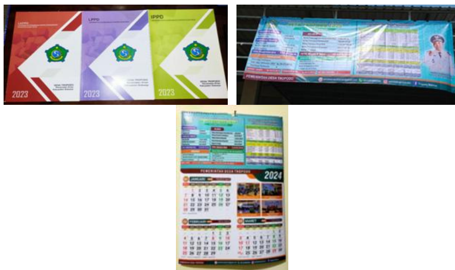
Gambar 11. Laporan LPPD, LKPPD, IPPD, Banner, & Kalendoskop Laporan Realisasi Tahun 2023

Gambar 11 merupakan foto Laporan (LPPD), (LKPPD), dan (IPPD) yang disampaikan kepada Bupati melalui camat, beserta Banner & Kalendoskop Laporan Realisasi Tahun Anggaran 2023 yang disampaikan kepada masyarakat: