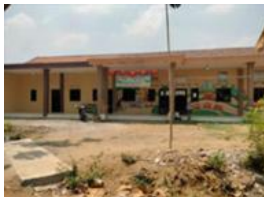
Gambar 7. Bentuk realisasi pembangunan infrastruktur Pembangunan PAUD Mickey Mouse Pencarian 2 (Thp3)