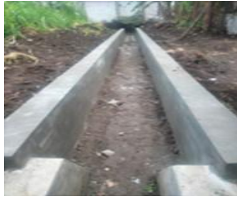
Gambar 3. Bentuk realisasi pembangunan infrastruktur Drainase Air Balepanjang RT 05