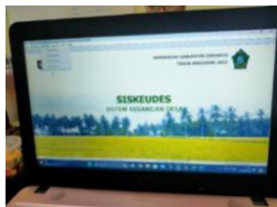
Gambar 9. Aplikasi SISKEUDES

Berikut foto aplikasi SISKEUDES yang telah digunakan Pemerintah Desa Tropodo dalam proses penatausahaan keuangan desa seperti diperlihatkan pada gambar 9.