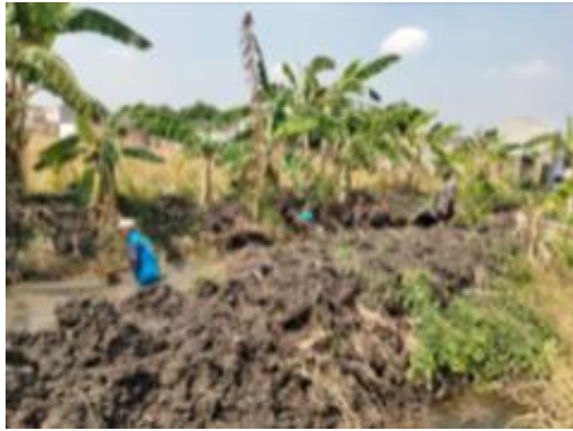
Gambar 2. Bentuk realisasi pembangunan infrastruktur PKTD Drainase Tropodo

Dalam pelaksanaan pembangunan infrastruktur di Desa Tropodo Krian sudah direalisasikan sesuai dengan kebutuhan masyarakat. Berikut merupakan beberapa bukti pembangunan infrastruktur di Desa Tropodo seperti diperlihatkan pada gambar 2 sampai gambar 8.