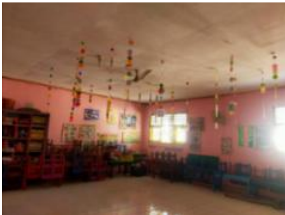
Gambar 4. Bentuk realisasi pembangunan infrastruktur Pemeliharaan TK DWP TROPODO (Atap) 2 Ruang Kelas Atap