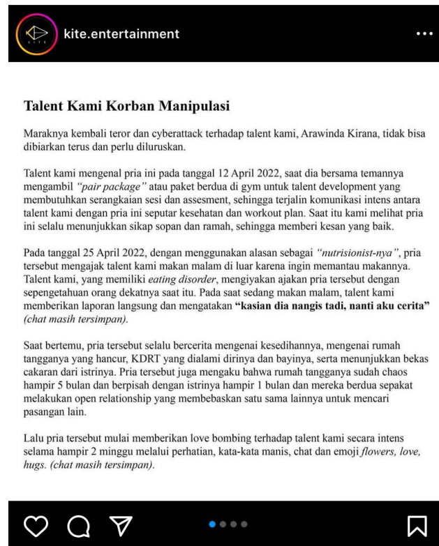
Gambar 1 Press Release KITE Entertainment terkait kasus Arawinda

Seperti kasus pada tahun 2022 lalu, seorang aktris nasional yang bernama Arawinda Kirana telah dituding oleh sebagian masyarakat dan terkena hate speech dan cyberbully oleh warganet karena menjadi pelakor atau orang yang merusak dan menyebabkan perceraian rumah tangga orang lain. Berawal dari seorang dokter bernama Amanda Zahra yang juga memiliki suami bernama Guido Ilyasa yang dikabarkan telah mengalami keretakan pada rumah tangganya.