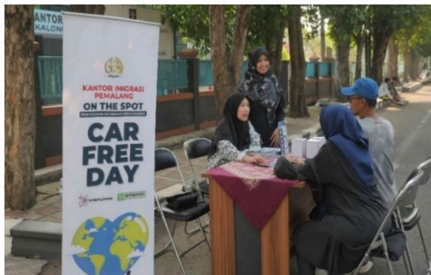
Gambar 2. Sosialisasi Pelayanan Keimigrasian

Gambar 2 menunjukkan kegiatan sosialisasi pelayanan keimigrasian yang dilakukan oleh petugas Teknologi Informasi dan Komunikasi Keimigrasian (TIKKIM) Kantor Imigrasi Kelas I Non TPI Pemalang pada acara Car Free Day yang bertempat di lapangan mataram Kota Pekalongan pada hari Minggu, 9 Juni 2024.