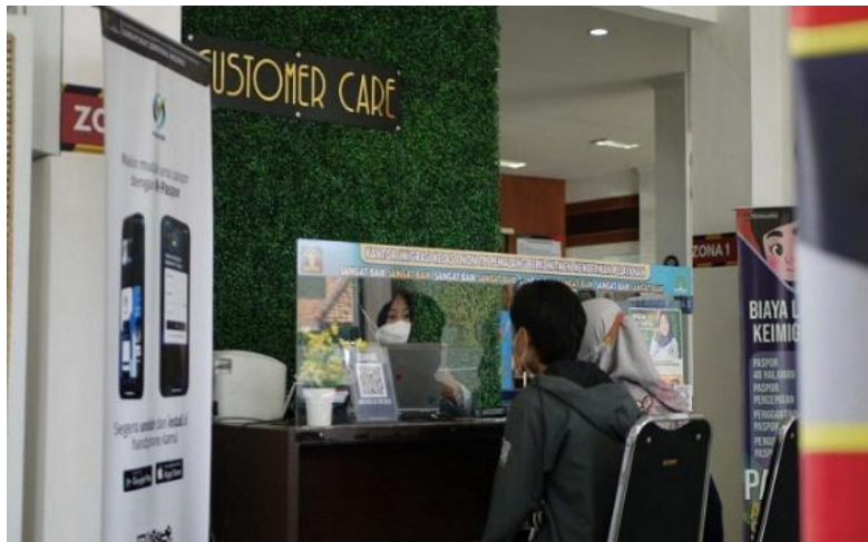
Gambar 4. Pelayanan Keimigrasian