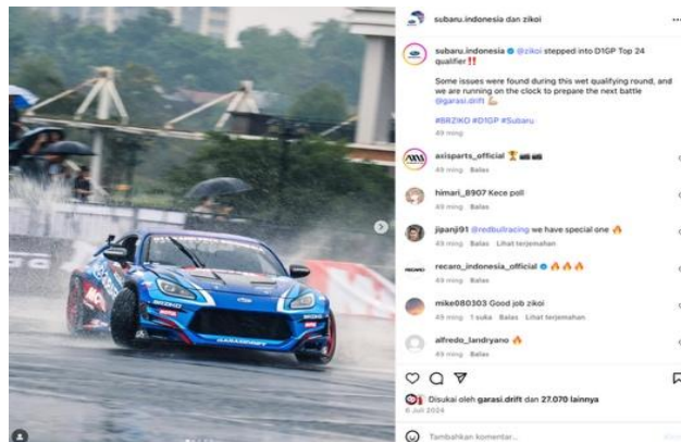
Gambar 6 Konten Spesialisasi

Nilai-nilai yang dipegang Ziko seperti kedisiplinan, sportivitas, kerja keras, dan edukasi konsisten ditampilkan baik secara eksplisit dalam caption maupun implisit dalam narasi visual. Dapat dilihat pada Gambar 6 Konten ini menampilkan konsistensi konten Ziko tentang dunia kompetitif dan drifting.