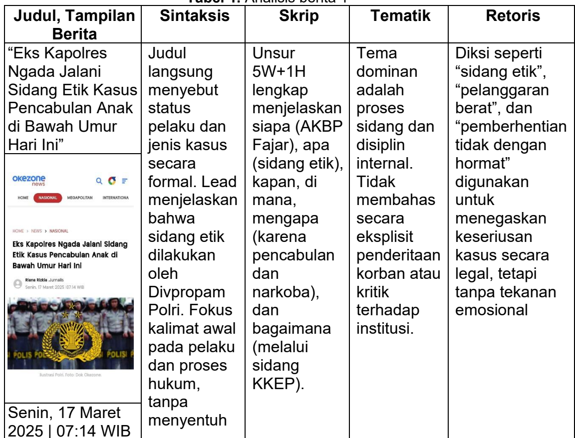
Tabel 1. Analisis berita 1