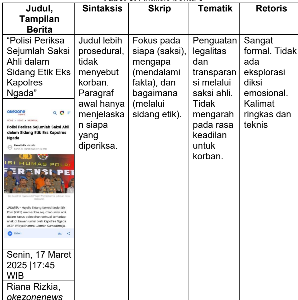
Tabel 3. Analisis berita 3

Berdasarkan hasil analisis terhadap tiga berita Okezone.com, dapat disimpulkan bahwa media ini menggunakan framing yang bersifat formal, prosedural, dan netral. Ketiga berita yang dianalisis lebih banyak menyoroti jalannya proses hukum internal melalui mekanisme sidang etik Divpropam Polri, pemanggilan saksi ahli, serta keputusan pemecatan terhadap AKBP Fajar Widyadharma. Struktur sintaksis yang digunakan cenderung langsung pada fakta dan pernyataan resmi, dengan minim eksplorasi terhadap kondisi korban maupun reaksi masyarakat. Skrip berita disusun berdasarkan alur kronologi hukum tanpa pengembangan narasi yang menyentuh sisi emosional. Secara tematik, Okezone lebih menekankan pada kredibilitas institusi dan pelaksanaan prosedur internal, sementara secara retoris bahasa yang digunakan bersifat teknis dan birokratis. Okezone.com memosisikan diri sebagai media yang menampilkan informasi