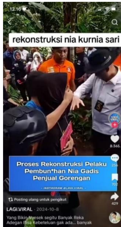
Gambar 4. Postingan dari akun @LAGI.VIRAL

baik yang mencari nafkah secara legal” semakin memperkuat efek emosional. Dampaknya, jutaan pengguna TikTok terlibat melalui komentar, tanda suka, dan unggahan ulang, yang mempercepat arus penyebaran informasi.