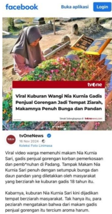
Gambar 6. Postingan dari akun @tvOneNews