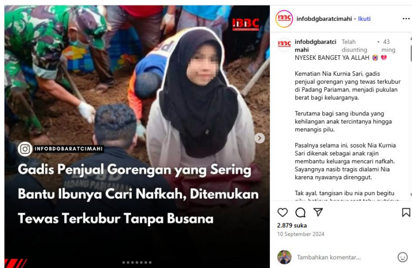
Gambar 1 Postingan dari akun @infobdgaratcimahi

kemarahan yang terungkap melalui kolom komentar. Unggahan ini menyoroti momen mengharukan ketika keluarga korban menyampaikan kesedihan mendalam atas kehilangan putri mereka. Nuansa emosional unggahan tersebut semakin diperkuat oleh caption yang diawali dengan kalimat: “NYESEK BANGET YA ALLAH” yang berfungsi sebagai pemicu perhatian sekaligus mempertegas ekspresi duka, sehingga mampu menyentuh emosi publik. Ungkapan tersebut tidak hanya merepresentasikan rasa kehilangan, tetapi juga mendorong lahirnya empati bersama. Intensitas emosi yang tergambar menjalin ikatan emosional antara keluarga korban dengan warganet. Alhasil, unggahan ini tidak sekadar menjadi viral, melainkan turut menggerakkan dukungan luas serta seruan keadilan dari berbagai lapisan masyarakat.