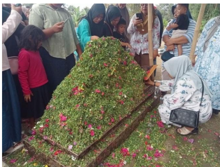
Gambar 7. Postingan dari akun @tvOneNews

Kehadiran warga dalam jumlah besar menjadi simbol bahwa kematian Nia tidak hanya menjadi tragedi personal bagi keluarga, tetapi telah menjadi tragedi publik yang menyentuh kesadaran kolektif masyarakat. Dalam kerangka komunikasi viral, fenomena ini menegaskan bahwa konten media sosial tidak semata berhenti pada ranah digital, melainkan turut mendorong lahirnya aksi