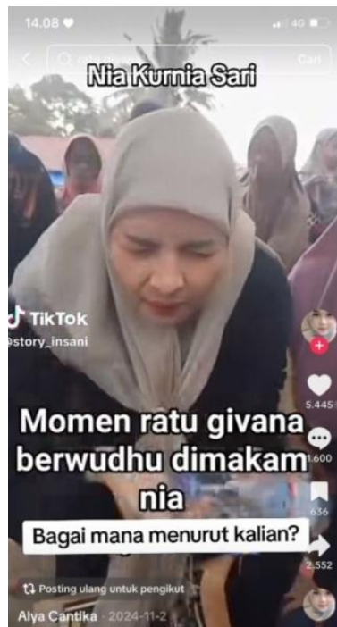
Gambar 5. Postingan dari akun @Alya Cantik

Reaksi kontra dari publik segera membanjiri kolom komentar. Salah seorang warganet, melalui akun @Muhammad_reza77, menuliskan dengan nada sinis: