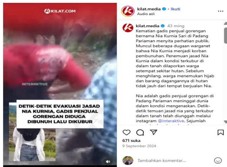
Gambar 2 Postingan dari akun @kilat.media

Tanggapan netizen terhadap unggahan tersebut menunjukkan empati sekaligus kemarahan yang mendalam terhadap pelaku kekerasan. Mayoritas komentar menuntut keadilan, bahkan ada yang mendesak pelaku untuk dihukum mati. Misalnya, akun @tabenasinaga menulis: