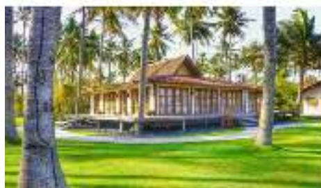
Gambar 3 Tampilan Villa Solong Banyuwangi