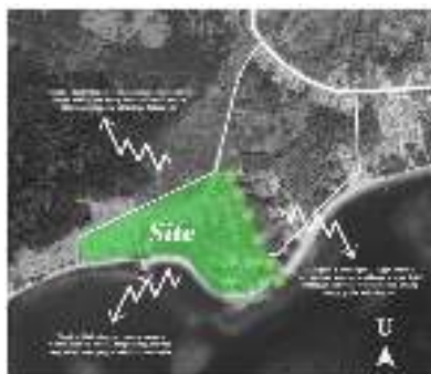
Gambar 9 Analisa Kebisingan

Potensi : Site sudah terletak diposisi yang strategis sehingga berkurang potensi kebisingan yang dapat mengganggu aktivitas didalamnya.