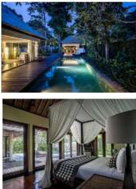
Gambar 4 Fasilitas Kayumanis Nusa Dua Private Villa & Spa

Kayumanis Nusa Dua Private Villa & Spa adalah sebuah resort villa mewah yang berada dikawasan nusa bali yang terkenal dengan sebutan daerah pantai-pantai indah yang dikelola oleh pemerintah, kehidupan serba mewah dan fasilitas liburan yang lengkap. Desain arsitektur pada villa dengan kesan yang elegan dan modern. Dengan sentuhan tradisional bali membuat vila yang dirancang ini memperhatikan privasi dan kenyamanan para pengunjung yang dilengkapi dengan taman tropis yang indah disekitaran pekarangan Kawasan.