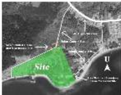
Gambar 8 Analisa Sirkulasi Pencapaian Kendaraan dan Pejalan Kaki

Potensi : Pencapaian ke lokasi cukup mudah karena berdekatan dengan Jl. Trans Sulawesi yang merupakan jalan utama provinsi secara nasional sehingga dapat mudah dicapai oleh para pejalan kaki dan kendaraan para pengunjung dan wisatawan.