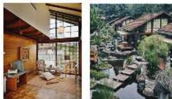
Gambar 5 Interior dan Pekarangan Kawasan Villa Air Natural Resort

Fasilitas yang dimiliki Villa Air Natural Resort dalam menarik daya Tarik dalam mengunjunginya adalah kolam renang indoor yang nyaman, Kafe bunga yang dijadikan sebagai tempat makan, Gift shop bagi para pengunjung ingin membeli oleh-oleh selepas berkunjung ke villa ini, Indoor sport bagi yang mau menjalankan rutinitas dalam berolahraga dan penyediaan meeting room. Villa ini mengandung gaya arsitektur tradisional dan modern yang dikelilingi oleh taman zen.