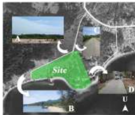
Gambar 10 Analisa View