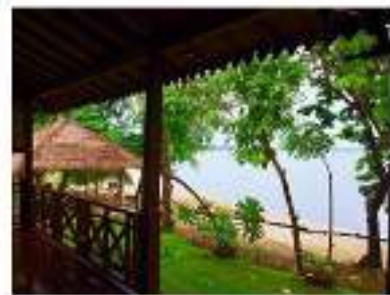
Gambar 2 Villa Tengkek Karimunjawa