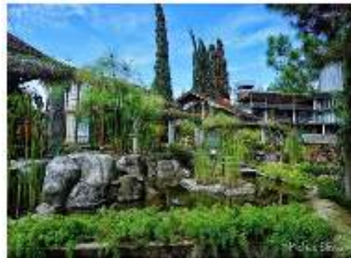
Gambar 12 Suasana lingkungan Villa air natural Resort di Lembang, 2020

termal antara dilingkungan yang beriklim tropis dan perpenduan unsur alam yang ada disekitarnya. Seperti pada Gambar 12, Yang menggambarkan Suasana lingkungan villa yang berada di iklim tropis, terdapat beberapa unsur elemen yang diterapkan dalam kawasan ini antara lain beberapa jenis vegetasi, aliran air, beberapa batuan, penggunaan kaca, dan material kayu yang natural yang memberi kesan alami seperti berada di alam sebenarnya sehingga pada perancangan Villa Resort ini akan mengadaptasi beberapa unsur elemen seperti pada Villa air natural resort di lembang.