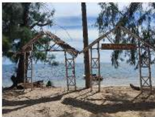
Gambar 1 Fasilitas ruang terbuka pada kawasan villa kencana boalemo

Adapun faktor permasalahan lainnya yaitu sirkulasi kawasan tidak terorganisir dengan baik yang tidak memiliki penandaan atau petunjuk arah yang jelas seperti jarak antara pintu masuk Kawasan Villa dengan lobby cukup jauh sehingga membuat tamu kesulitan saat berkunjung untuk mencari informasi (lobby) mengenai fasilitas villa. Selain itu, permasalahan lainnya yaitu pengembangan fasilitas pendukung yang tidak memadai. Jumlah wisatawan yang menginap ke villa ini biasanya cukup ramai pada hari-hari weekend atau hari-hari tertentu berdasarkan data estimasi jumlah penggunaan unit villa yang terpakai. Akan tetapi, fasilitas yang tersedia pada perlu dikembangkan lagi dengan menyediakan berbagai atraksi wisata seperti penambahan lapangan bola pantai, spot foto yang instagramable dan yang lain-lain agar memberi kesan pengalaman yang menarik saat berlibur dan menarik pengunjung khususnya wisatawan mancanegara yang telah berkurang dalam menarik minat kunjungan yang tertera dalam hasil nilai capaian kinerja sebesar 0,03% pada Laporan Akuntabilitas Kinerja Instansi Pemerintah (LAKIP) Dinas Pariwisata dan Kebudayaan Kabupaten Boalemo 2022 sehingga perlu adanya daya tarik minat wisatawan mancanegara berkunjung ke kabupaten boalemo.