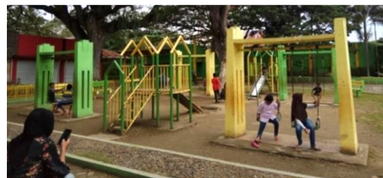
Gambar 3. Anak-anak bermain ayunan di Taman Kota

Aktivitas bermain anak diurutkan dari aktivitas yang paling sering sampai dengan paling jarang dilakukan. Urutan pengelompokan ini didasarkan atas hasil penelitian yang ada. Aktivitas bermain anak-anak di Taman Kota meliputi: bermain ayunan, perosotan, pasir, air, bersepeda, naik odong-odong, mobil-mobilan, skuter listrik, motor-motoran, bermain kejar-kejaran, dan bermain sepak bola. Adapun aktivitas yang paling digemari dan cukup sering dilakukan oleh anak-anak adalah bermain ayunan, perosotan, kejar-kejaran, dan sepak bola.